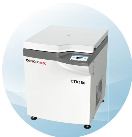
CTK150大容量低速 (自动脱盖)