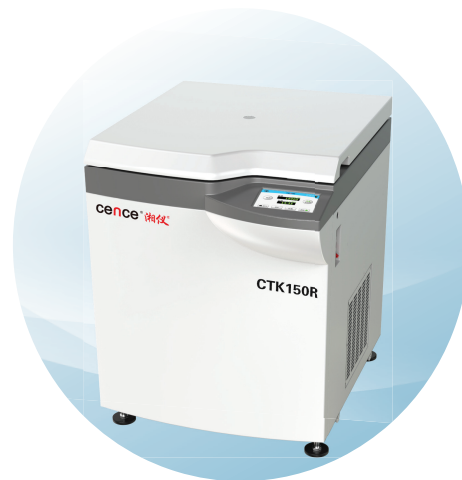
CTK150R大容量低速冷冻 (自动脱盖)